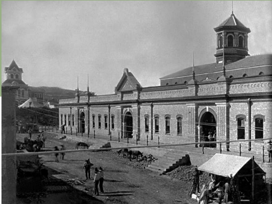
Mercado Juárez antes de ser inaugurado.

Es sorprendente lo que puede hallarse en la caja fuerte de una ferretería, en particular si ese establecimiento es uno de los comercios más antiguos que existen en Saltillo, al grado de que su registro en la Cámara de Comercio de Saltillo corresponde al número 1, pero ¿qué podemos encontrar en esa caja fuerte que pueda ser de interés para nosotros en la actualidad?